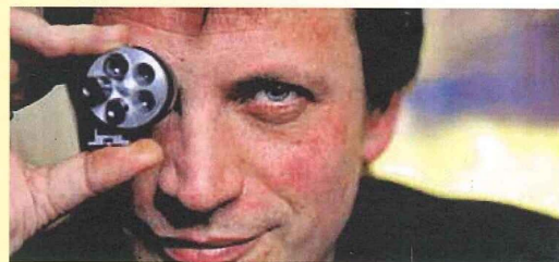
Il regista Dalibor Matanić

vane Merisi nell'atelier del d'Arpino, sviluppando così la sua specializzazione nel campo della natura morta. Per attestare come la lezione del Maestro di Hartford venne raccolta da vari naturamortisti, nella seconda sezione della mostra campeggiano rare tele del "Maestro del vasetto" e del "Maestro delle mele rosa dei Monti Sibillini". La terza sezione è invece dedicata ai pittori che frequentarono l'Accademia istituita dal marchese Giovanni Battista Crescenzi nel suo Palazzo alla Rotonda, adiacente al Pantheon. Sulla scorta delle fonti antiche, sono esposte tele di Pietro Paolo Bonzi detto Gobbo dei Carracci, del Maestro della natura morta Acquavella – che la critica è propensa a identificare con Bartolomeo Cavarozzi – e dello stesso Crescenzi.