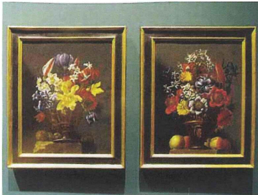
Due quadri esposti a Roma

Se Caravaggio licenziò l'archetipo della natura morta italiana, il Maestro di Hartford – pittore attivo nella cerchia del Cavalier d'Arpino – si guadagnò un ruolo chiave per la diffusione della nuova iconografia, essendo il più antico specialista di natura morta attivo a Roma tra il XVI e il XVII se-